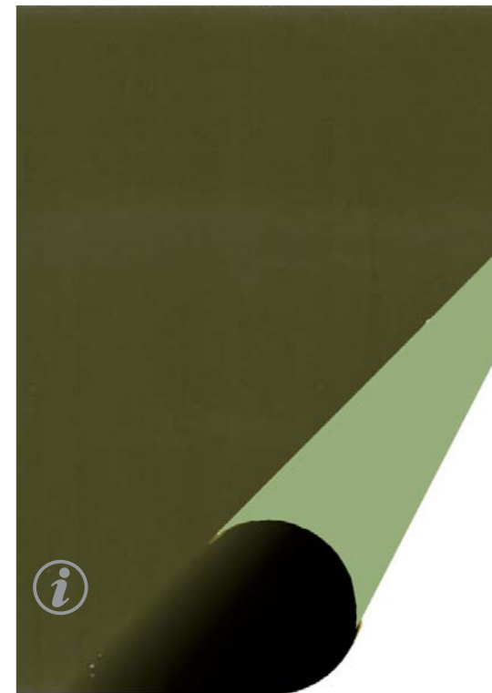
799 696 Polyplan Military Nato-Premium 205 cm