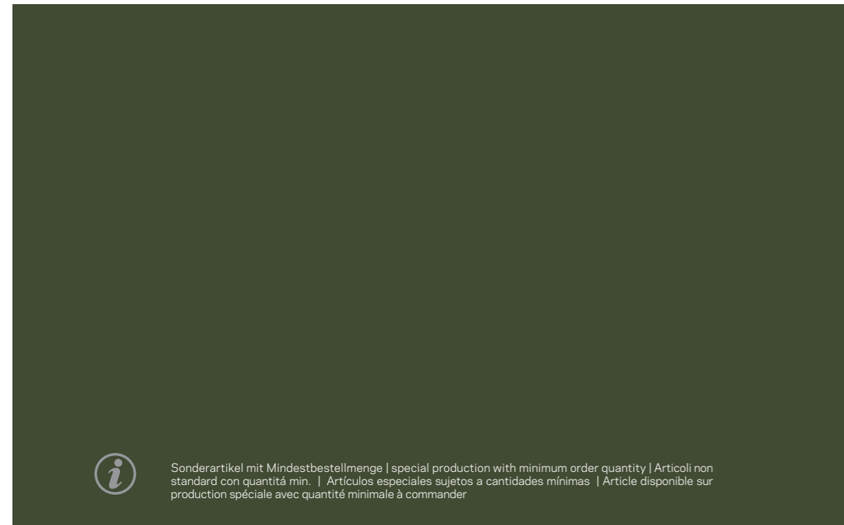
708 687 Polyplan Military Nato-Classic 120 cm